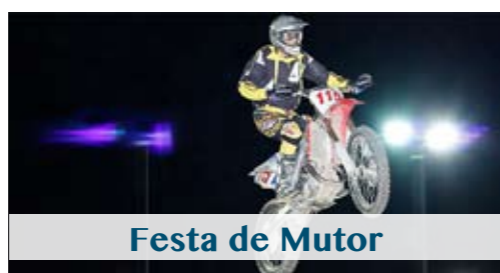
Festa de Mutor