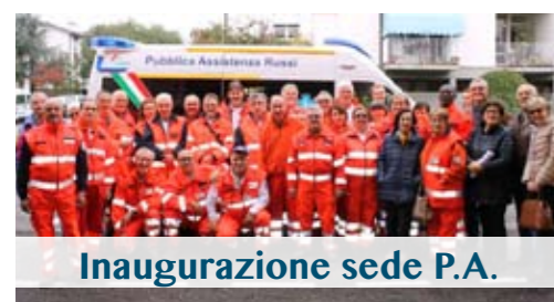
Inaugurazione sede P.A.