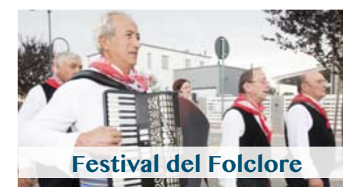
Festival del Folclore